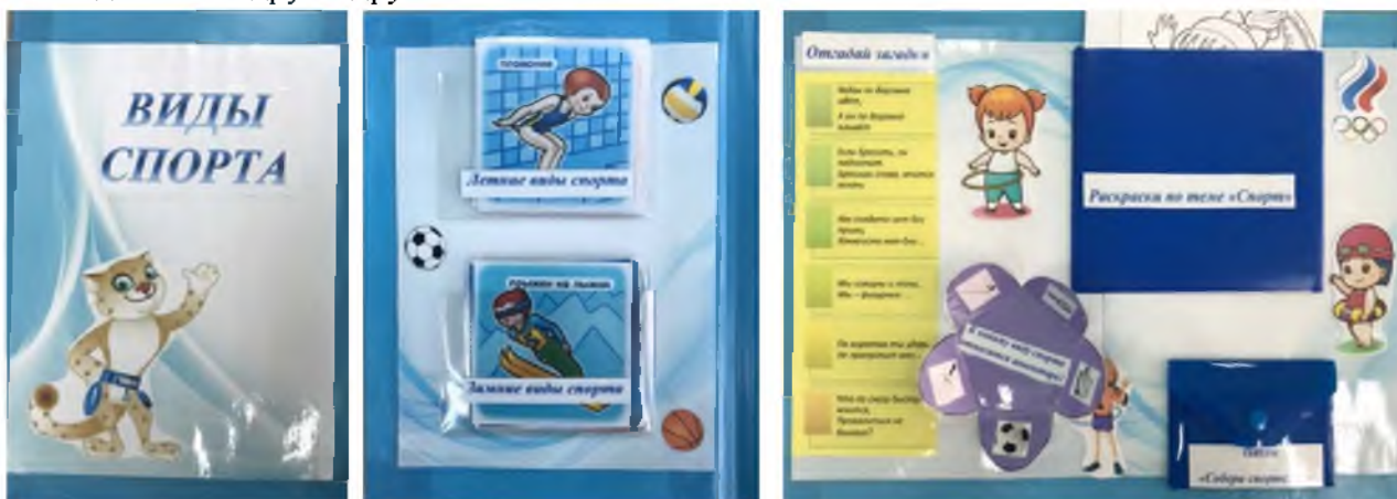
Рис. 3. Лэпбук «Виды спорта»

Большое функциональное значение приобрело дидактическое пособие Лэпбук «Виды спорта». Оно изготовлено своими руками для работы с детьми с нарушениями речи и слуховой депривацией. Целью создания лэпбука является формирование представлений о различных видах спорта, повышение мотивации у детей к занятиям спортом и физической культурой, приобщение к здоровому образу жизни. Использовать такое дидактическое пособие можно как на групповых занятиях, так и для индивидуальной работы с детьми. Лэпбук поможет закрепить изученный материал, способствует развитию речи, внимания, памяти и мышления [11]. Задания, предложенные в лэпбуке, позволяют развивать чувственную сферу, стимулируют к мыслительной деятельности и способствуют тесному взаимодействию друг с другом.