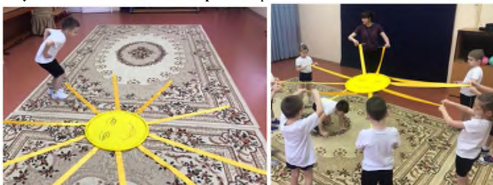
Рис.4. Игровое пособие «Солнышко»

В процессе учебных занятий с использованием мультимедийного оборудования у обучающихся формируются специальные знания, жизненно-необходимые двигательные умения и навыки, а также повышаются функциональные возможности различных органов и систем. Проведение физических упражнений в таких условиях позволяет решить коррекционно-развивающие, компенсаторные и профилактические задачи. Во многом реализация поставленных целей и задач зависит от педагогического мастерства и творческого подхода к организации образовательного процесса. Многофункциональное значение приобрело игровое пособие «Солнышко» , изготовленное из специальной ткани. Оно привлекает ребят своей красочностью. Пособие лучше использовать на групповых занятиях. Функциональное значение направлено на развитие основных видов движений: упражнения по развитию мелкой моторики рук, ходьба (перешагивание через солнечные лучи), прыжки, «пролезание под солнышком». Выполняя музыкально-ритмические упражнения ребята с интересом повторяют движения, это дает им заряд положительных эмоций и удовольствие от процесса выполнения заданий. Немаловажным является применение пособия с целью развития звуковой культуры и грамматического строя речи, обогащение словарного запаса. Для каждой возрастной группы сформированы задания с постепенным усложнением методов и приёмов работы.