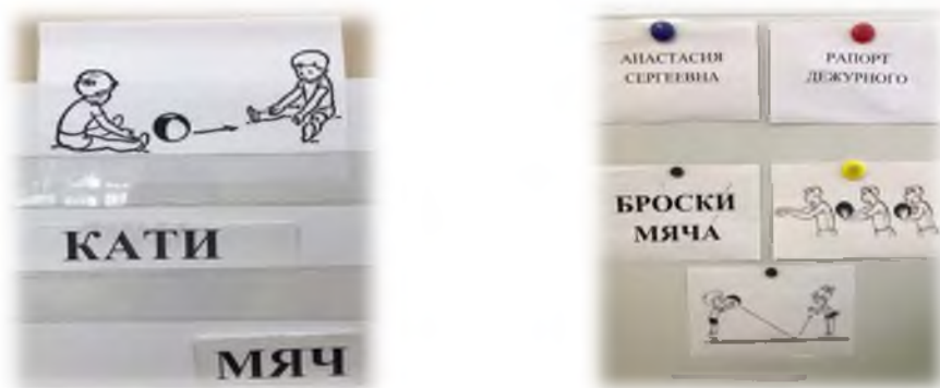
Рис.2. Карточки с рисунками и схемами движений

Имеющиеся наглядно-дидактические пособия адаптированы и совершенствованы нами для каждой возрастной категории детей дошкольного и младшего школьного возраста.